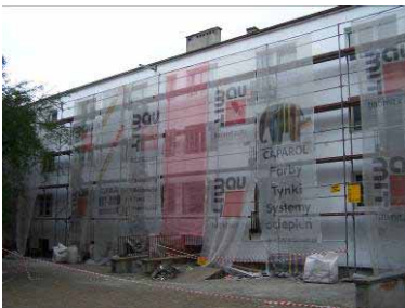
Sambora Strasse, Polen