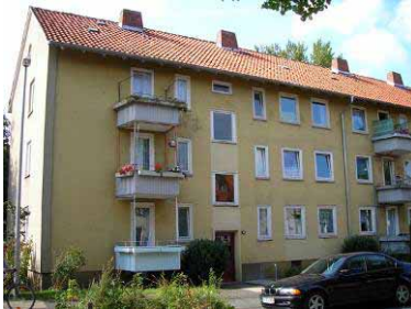
Beuthener Straße, Deutschland