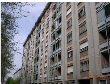
Via Adamello, Italien